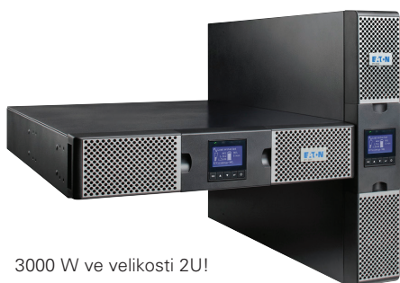
3000 W ve velikosti 2U!